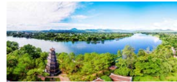
Hue/ Da Nang